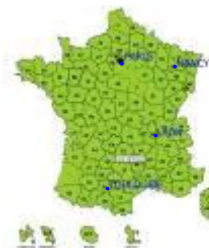
Asconit Consultants en France et dans les DOM TOM

Martinique, Mayotte et de la Réunion ). Nombre de ces experts ont un passé international, en particulier en Asie. Ce panel important d'experts permet ainsi de réaliser des projets multidisciplinaires.