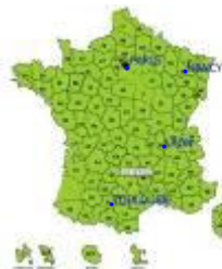
Asconit Consultants en Francia y territorios franceses de ultramar

continentales francesas ( Lyon, Toulouse, Nancy, París ) y territorios franceses de ultramar ( Islas de Martinica, Mayotte y de la Reunion ). Muchos de ellos tienen un pasado internacional, en particular, en Asia. Nuestro importante panel de expertos permite